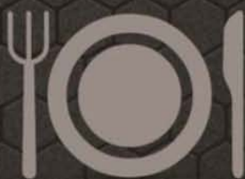
RESTAURANT BAR CAFE