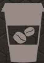
VENTE A EMPORTER