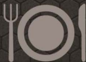
RESTAURANT BAR CAFE